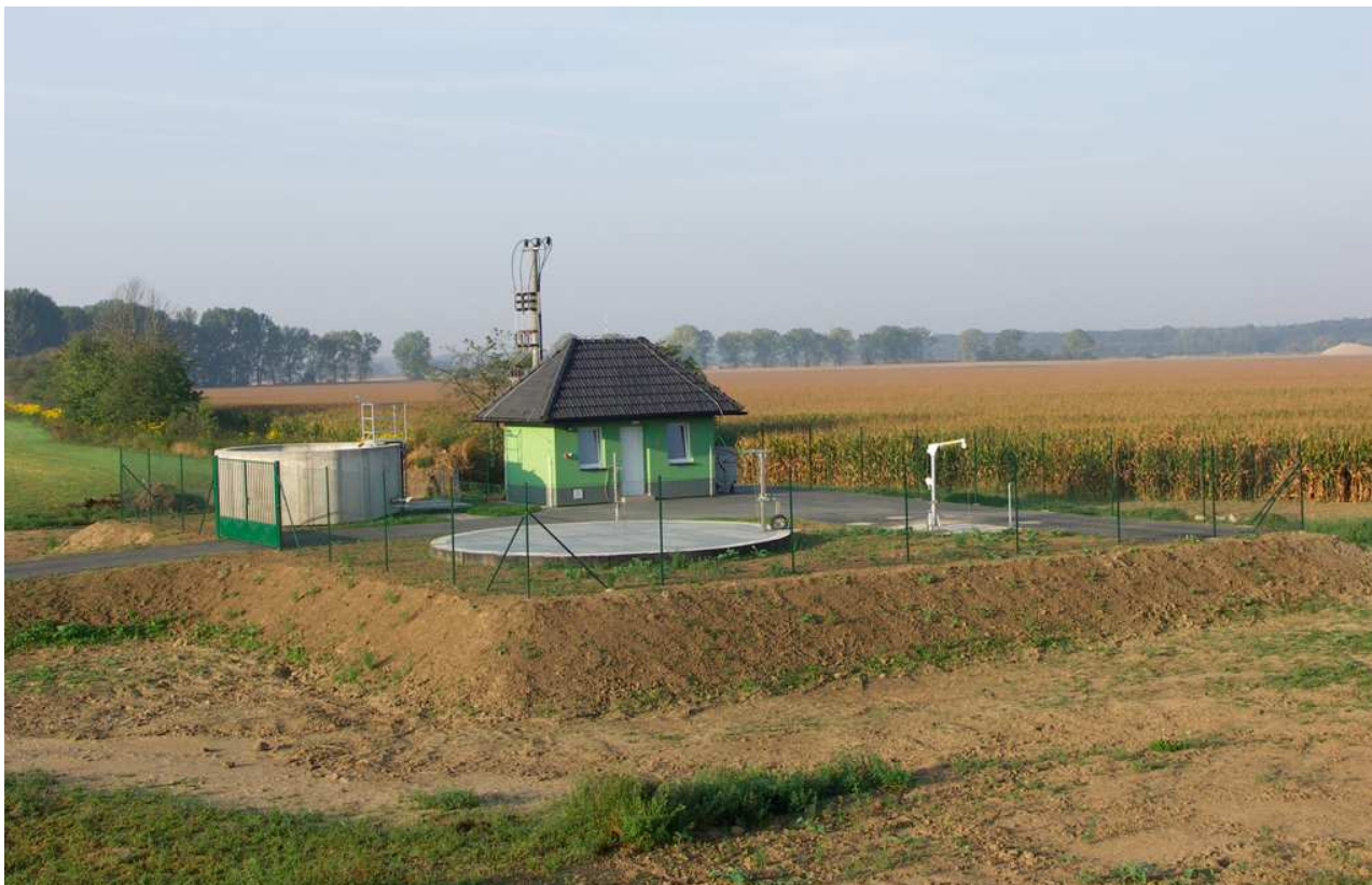
Nová čistička odpadních vod v Krčmani.