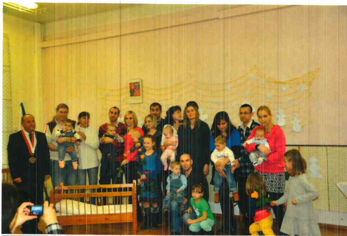
“Vítání krčmaňských občánků 2013.