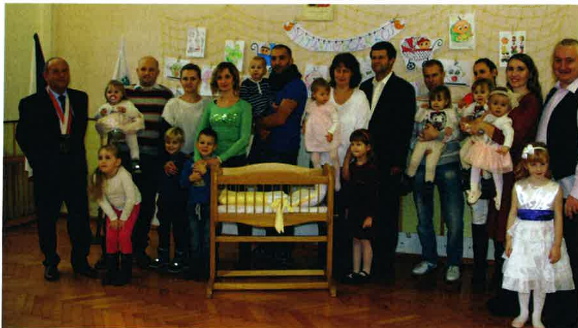
Vítání občánků v Krčmani 10. 12. 2017.