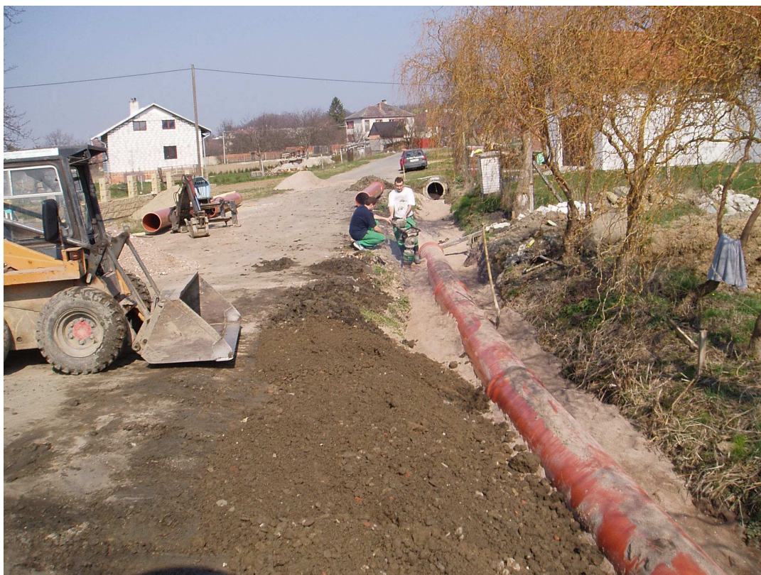
Zatrubnění příkopu v ulici Pod Sokolovnou