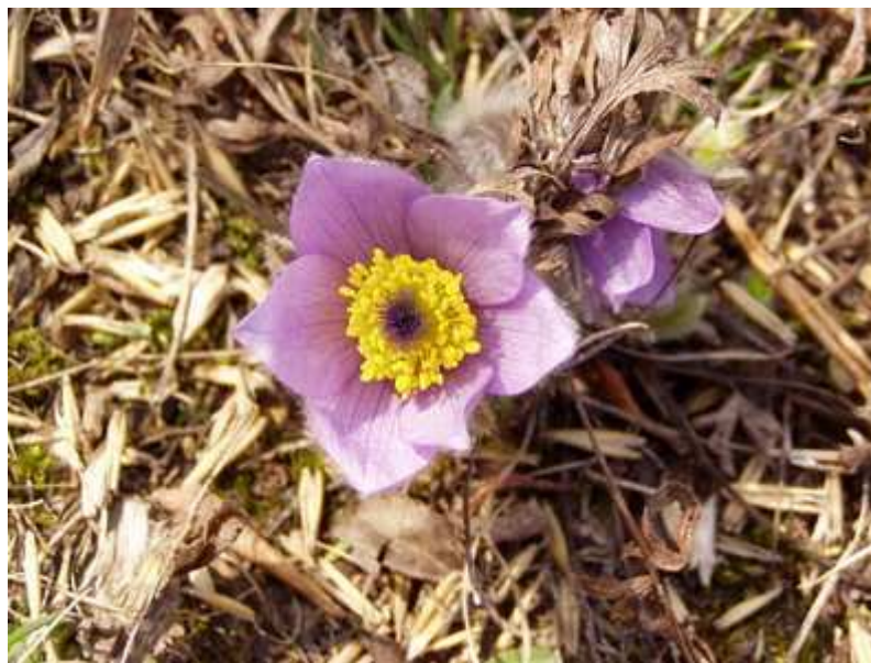
Koniklec velkovětý