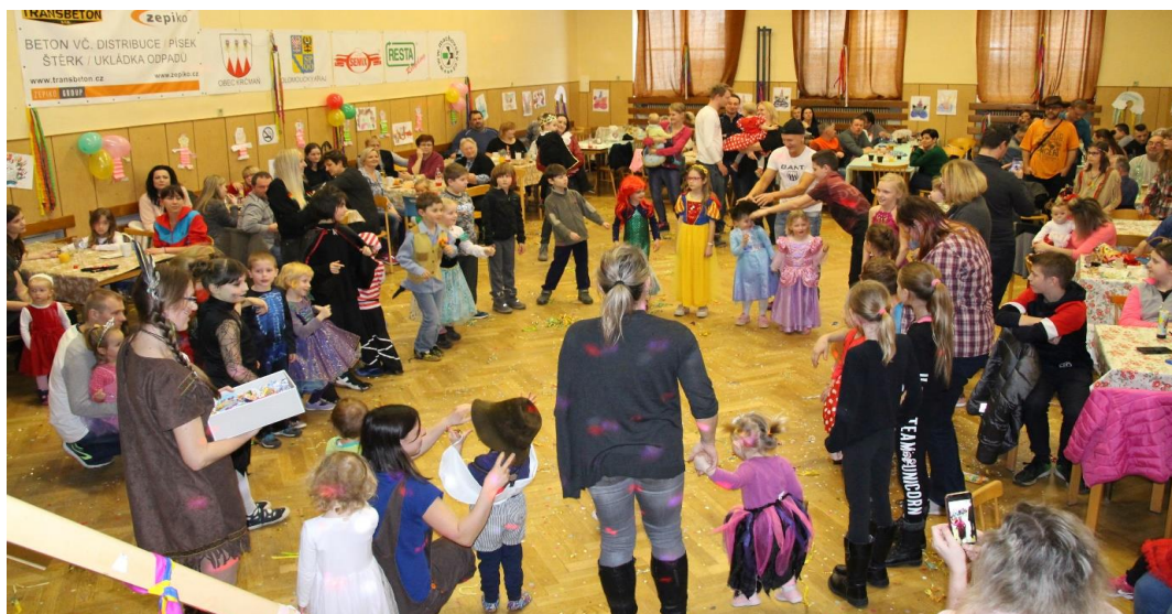
Dětský karneval v Krčmani - 29. února 2020.